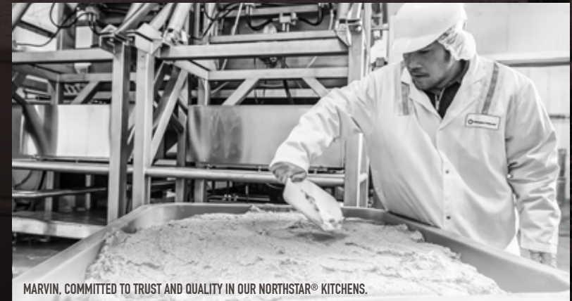
MARVIN. COMMITTED TO TRUST AND QUALITY IN OUR NORTHSTAR® KITCHENS.

Wij bereiden Orijen zelf in onze eigen keukens waar we de controle hebben over ieder detail, van receptuur ontwikkeling, voedselveiligheid tot ingrediënt keuze en bereiding. Wanneer u kiest voor ORIJEN kunt u er op vertrouwen dat uw kattenvoer is bereid met de zorg, attentie en het vertrouwen dat u verdient.