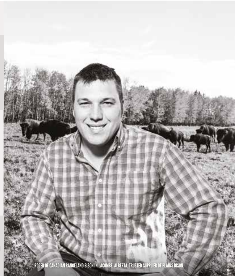
ROGER OF CANADIAN RANGELAND BISON IN LACOMBE, ALBERTA. TRUSTED SUPPLIER OF PLAINS BISON.